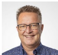
Beat Epp Eventmanagement LUKS Luzern